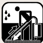
Spray extraction straight