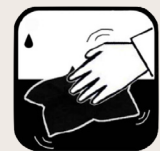
Abwischen mit Baumwolltuch

Sie können entscheiden, ob eine (lokale) Reinigung Ihres Ecorugs erforderlich ist. Sprühen Sie James Interior Cleaner auf Ihren Ecorug und rubbeln Sie ihn anschließend mit einem trockenen weißen Frottiertuch in weiten, streichenden Bewegungen trocken. Wenn Sie sehen, dass sich die Verschmutzung vom Teppich löst, können Sie mit der Reinigung fortfahren.