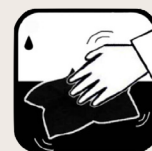
Essuyer à l'aide d'un chiffon en coton

Pour nettoyer localement votre Ecorug, vaporisez James Interior Cleaner, puis séchez avec une serviette éponge blanche et sèche en coton en appliquant de larges mouvements. Si vous voyez la saleté se décoller, vous pouvez continuer le nettoyage.