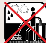
Extraction par pulvérisation rotative