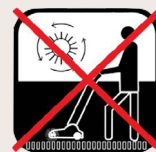
Aspirateur à brosse