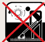
Nettoyage en poudre