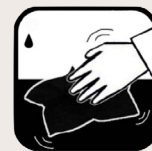
Veeg af met een katoenen doek

U kunt zelf bepalen of het nodig is om uw Ecorug (plaatselijk) schoon te maken. Smit James Interior Cleaner op uw Ecorug en wrijf hem daarna droog met een droge witte badstof handdoek, met brede vegende bewegingen. Als U ziet dat het vuil van het tapijt afkomt, kunt U doorgaan met schoonmaken.