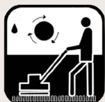
Reiniging van pads

Maak uw Ecorug NIET schoon met een tegengesteld roterende borstelmachine voor poederreiniging of een sproei-extractiemachine uitgerust met roterende mondstukken (Rotovac).